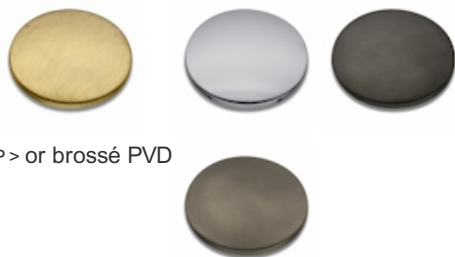
96P > or brossé PVD