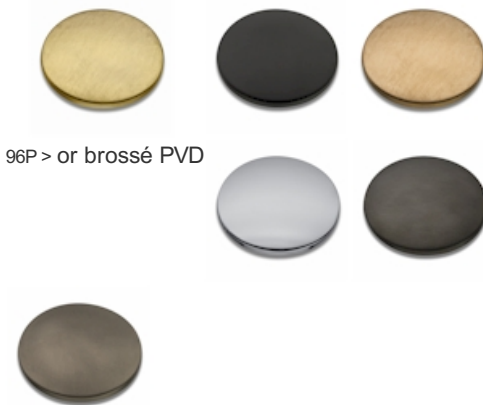
96P > or brossé PVD